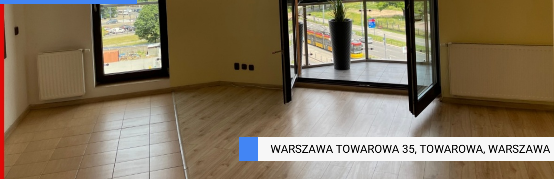
WARSZAWA TOWAROWA 35, TOWAROWA, WARSZAWA